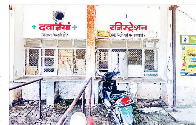
भिवानी। हड़ताल के चलते बंद पड़ी अस्पताल की ओपीडी सर्विस।

भवानीखेड़ा नागरिक अस्पताल में शनिवार को ओपीडी सर्विस बंद होने से मरीजों को काफी परेशानियों का सामना करना पड़ा जिसके चलते मरीज जानकारी के अभाव में चक्कर काटते हुए दिखाई दिए। मरीजों ने नाराजगी जताते हुए बताया कि स्थानीय प्रशासन को सूचनाई पट्टिका लगानी चाहिए ताकि मरीजों को दिक्कतों का सामना ना करना पड़े। उल्लेखनीय है कि करनाल में डॉक्टर के साथ हुई घटना के विरोध में पूरा स्वास्थ्य विभाग एकत्रित दिखाई