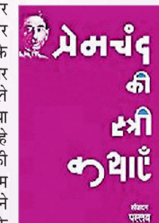
प्रेमचंद की स्त्री कथाएं