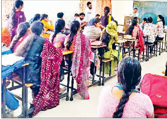
भवानीखेड़ा। आयोजित कार्यक्रम में छात्राओं को संबोधित करते एक वक्ता।