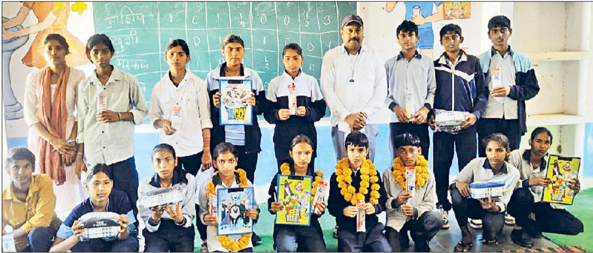
भिवानी। विषय की बेहतरीन तैयारी करने वाले बच्चों को प्रोत्साहन के रूप में सम्मानित करते शारीरिक शिक्षक।