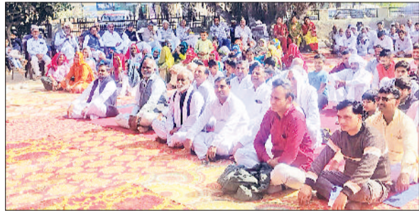
भिवानी। हिंदू सम्मेलन में मौजूद लोग।