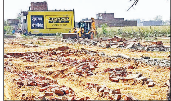
भिवानी। अवैध कॉलोनी में निर्माण तोड़ती जेसीबी।

एपॉक्सि ग्राउटिंग होगी भूमिगत पानी को रोकने के लिए फर्श या अन्य किसी जगह पर पहले छेद किए जाते हैं। उन छेदों में सीमेंट की बजाए एपॉक्सि रजिन, हाईड्रन और फिलर पाउडर का मिश्रण का उपयोग किया जाता है। उन छेदों से इस मिश्रण का घोल बनाकर प्रेशर की मशीन से डाला जाता है। जिस जगह पर यह डाला जाता है। वह छिद्र के जरिए नीचे जाकर फैल जाता है और पतल बन जाती है। वह पतल भूमिगत पानी को उपर नहीं आने देती है। जिससे वह जगह पानी, दूग धब्बे व रजिड प्रतिक्रियाओं हो जाती है।