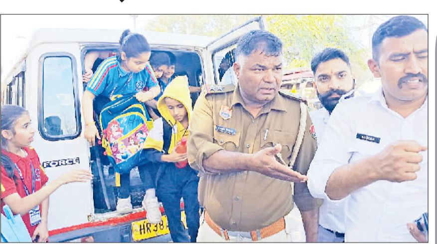
मिवानी। यातायात थाना प्रभारी द्वारा रूकवाई गई स्कूली क्रूजर वाहन से उतरे बच्चे।