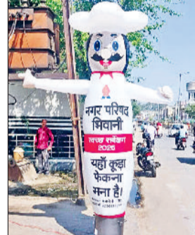
भिवानी। शहर में अवैध कचरा ढाड़ पर लगाया गया जयपुरी मस्कट

जगह-जगह कूड़ा फेंककर शहर को गंद बनाने वाले लोगों को समझाने के लिए नगर परिषद हर संभव प्रचार प्रसार के नए-नए प्रयोग कर रही है। इसी कड़ी में नगर परिषद ने जयपुरी से मस्कट मंगवाया है, जो नागरिकों से आवाहन कर रहा है कि आप सड़कों पर दुकानों के सामने कहीं पर भी कूड़ा कचरा ना फेंके। स्वच्छ सर्वेक्षण 2025 में छोटी काशी भिवानी शहर को देश भर में साफ सुथरा शहरों अक्वल स्थान पाने वालों में शामिल करने में अपना