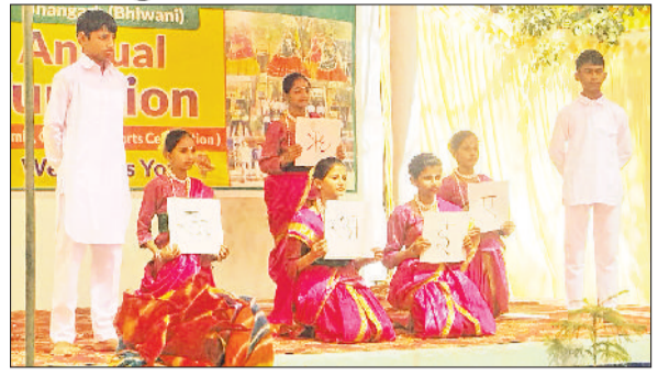
भिवानी। वार्षिकोत्सव में सांस्कृतिक प्रस्तुतियां देते विद्यार्थी।

■ बच्चों का अधिक से अधिक नामांकन सरकारी विद्यालयों करवाएं अभिभावक: डिप्टी डीईओ